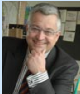
Guy VANHENGEL Brussels Minister

Vanhengel is niet aan zijn proefstuk toe, want hij heeft al heel wat belastingverminderingen doorgevoerd: zo heeft hij bijvoorbeeld al 2 keer de registratierechten op de aankoop van een eerste onroerend goed flink verlaagd. Ook de schenkingsrechten en de successierechten werden al substantieel verminderd. Fantastisch, zult u zeggen. Heel normaal, vinden wij, Guy Vanhengel is nu eenmaal een liberaal!