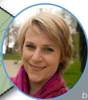
Ann Brusseel Vlaams parlementslid

“ Brussel is New York niet. Of toch qua diversiteit én in het klein. Twee op drie Brusselaars is van vreemde afkomst: immigranten uit Noord-Afrika of het Nabije Oosten, politieke vluchtelingen van zowat overal, EU-burgers die in de hoofdstad van Europa werken... Brussel is qua bevolking, net als New York, atypisch voor het land. In Brussel kan je gerust stellen dat niet onze afkomst, maar onze gedeelde toekomst ons bindt.” -- Ann Brusseel